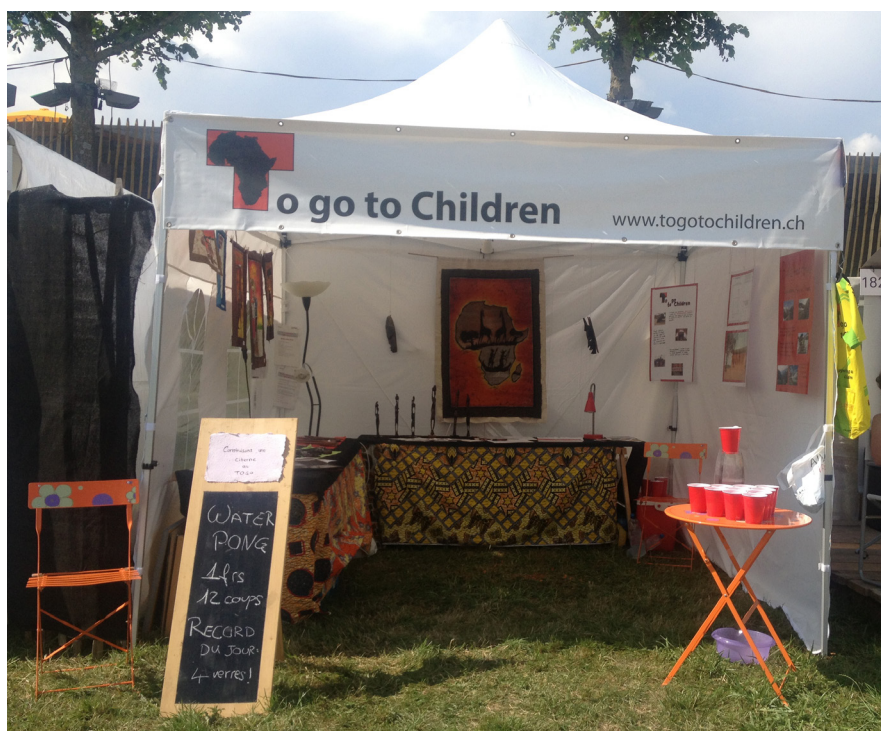
Le stand d'informations au Paléo festival Nyon en 2013

Et pour 2014 ? : Après cinq ans d'activité et le premier projet de construction en bonne voie, l'association To go to Children ne souhaite pas s'arrêter là ! En effet, un prochain projet va être étudié par les membres du comité. Tous les membres de To go to Children sont unanimes pour que le prochain projet reste dans le domaine de l'enfance. Pour le reste, ce n'est que musique d'avenir !