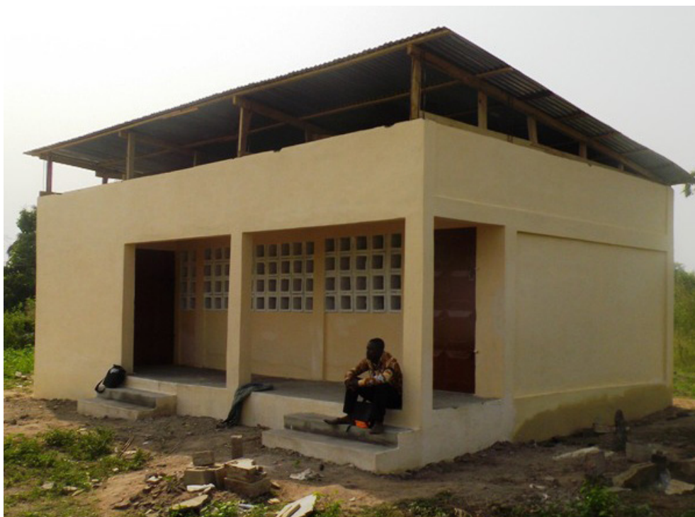
Première photo de l'école terminée, décembre 2013

Vous trouverez toutes les informations sur son site internet bikeforafrica.ch . Toute l'équipe de To go to Children souhaite le remercier chaleureusement pour son investissement.